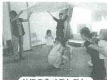
幼児の会 'ぶんぶん'